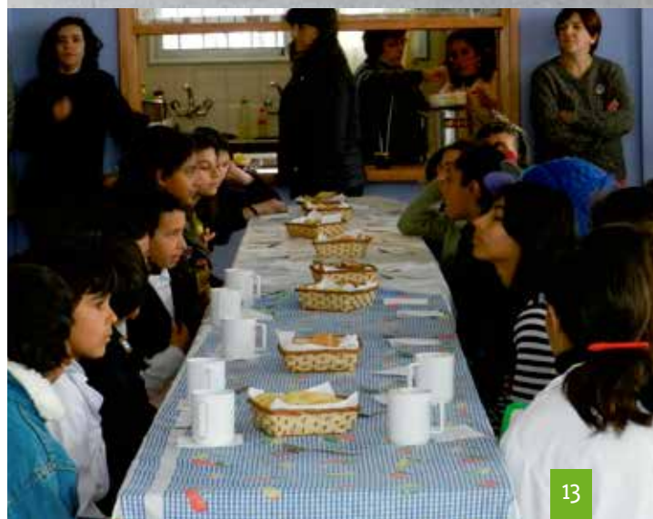
Niños y niñas de Escuelas Rurales y de la Escuela N° 382 junto con docentes y educadores